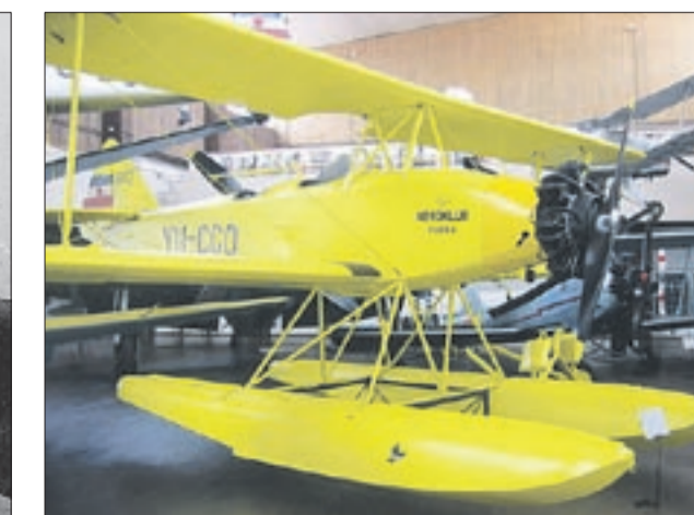
Hidroavion inženjera Fizića čuva se u zagrebačkom Tehničkom muzeju