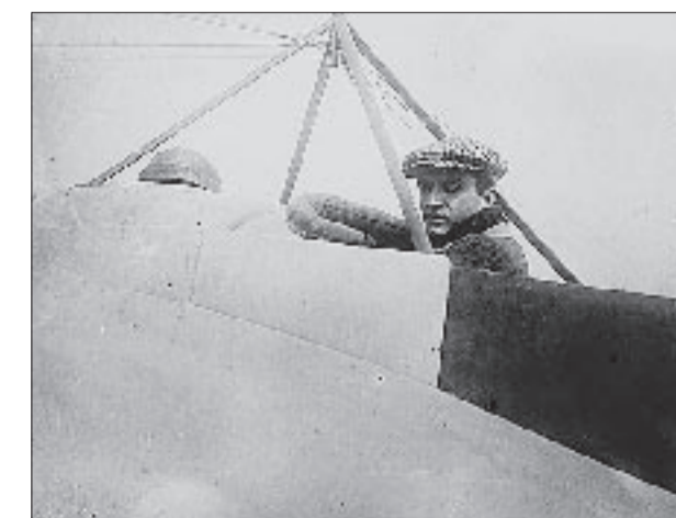
Hrvat - najbolji pilot Europe, Ivan Bjelovučić